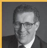
Landrat Peter Polta Landkreis Heidenheim